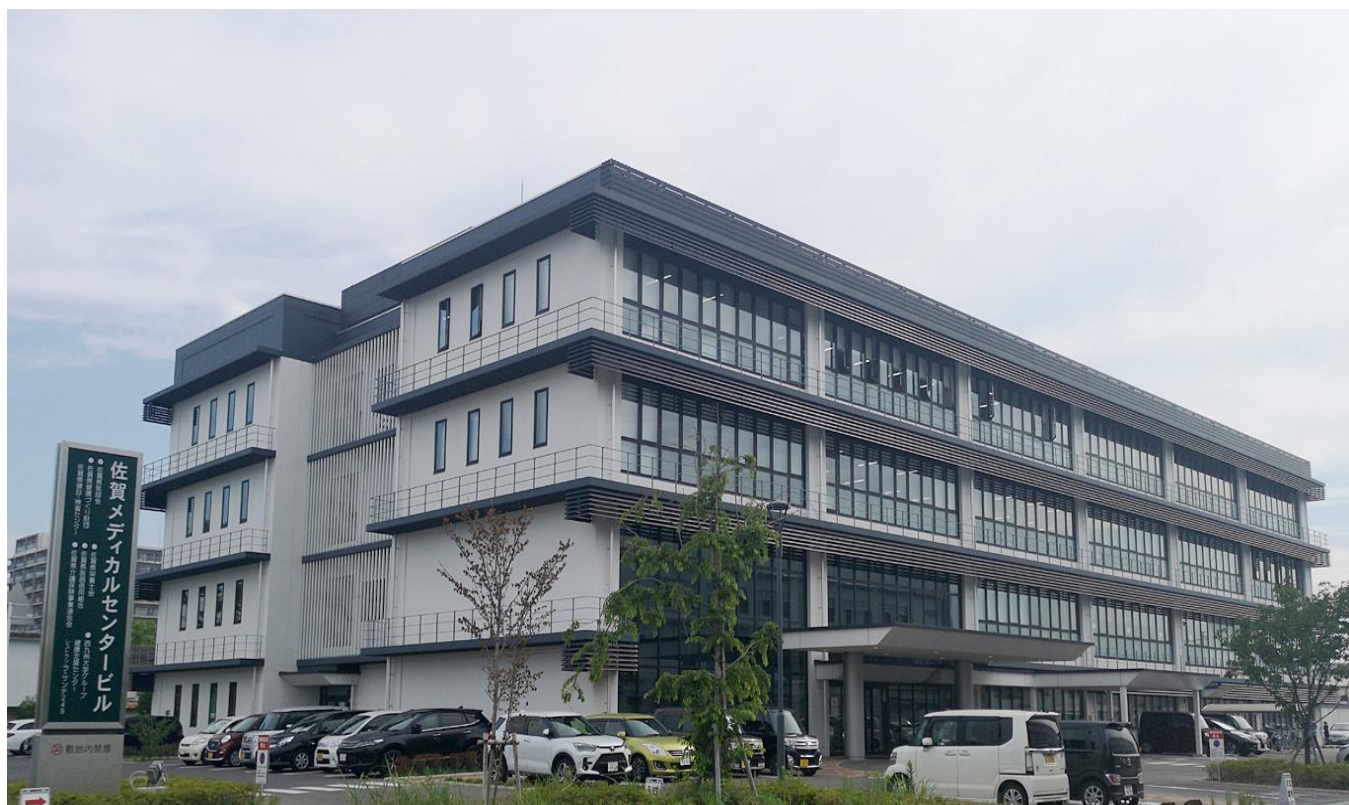
佐賀メディカルセンタービル